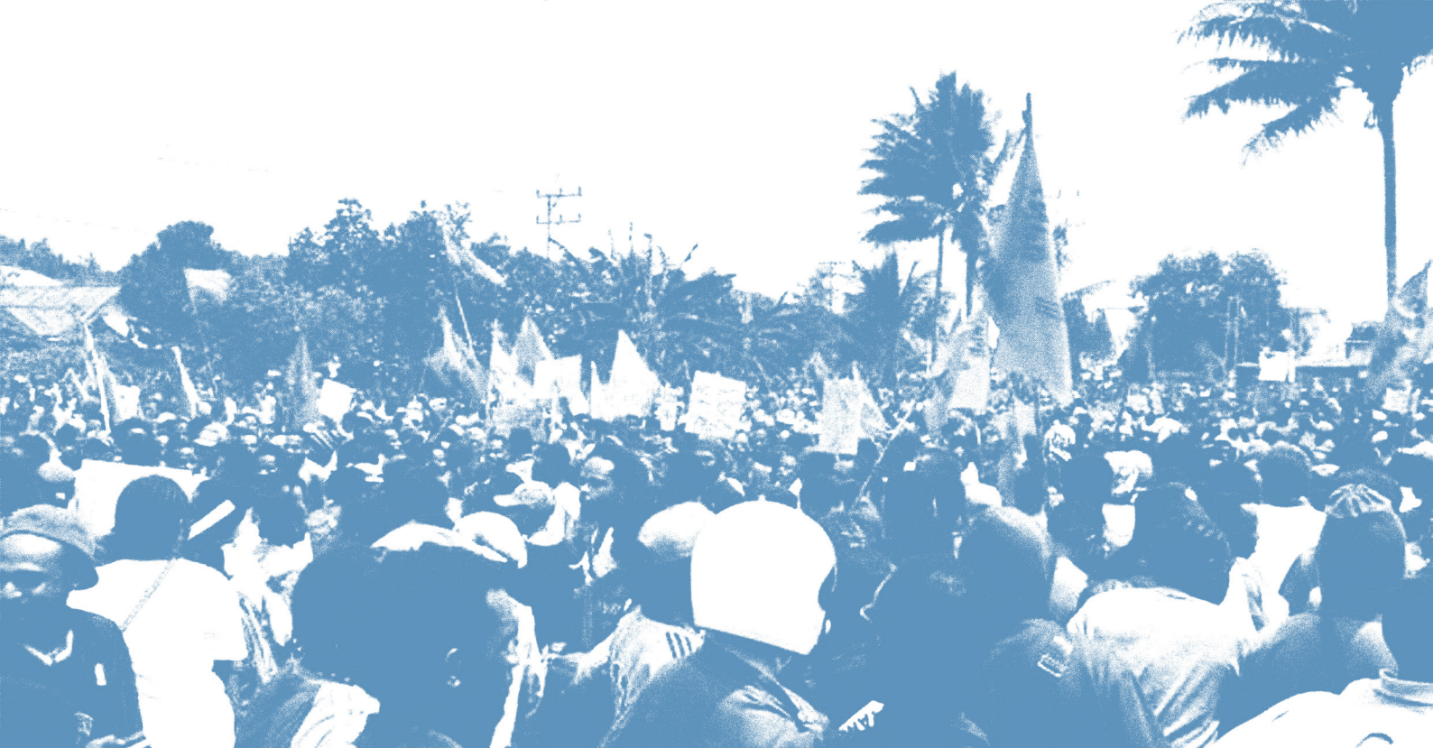
Demonstrasi KNPB pada April 2016.