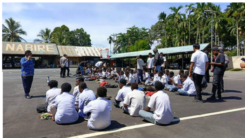
Gambar 3. Puluhan pelajar dikumpulkan di lapangan Polres Nabire, Kab. Nabire, Prov. Papua Tengah, setelah demo penolakan mereka atas program Makan Bergizi Gratis dibubarkan polisi, 17 Februari 2025.

Terdapat 78 penangkapan baru antara Januari dan Maret 2024. Dalam periode ini kami mendokumentasikan 50 kasus baru yang melibatkan penangkapan sewenang-wenang terhadap anak muda Papua (berusia antara 15 dan 17 tahun). Hampir semuanya adalah pelajar SMA di Nabire, Provinsi Papua Tengah, yang ditangkap pada 17 Februari lalu karena memprotes Program MBG. Para pelajar SMA di Nabire menamakan koalisi mereka Solidaritas Pelajar West Papua (SPWP). Para demonstran berkumpul di sebuah pasar lokal di Kota Nabire dan mulai berjalan kaki ke kantor dinas pendidikan setempat untuk menyampaikan keprihatinan mereka karena beberapa media telah melaporkan banyak kasus pelajar yang keracunan akibat MBG dan mereka menuntut agar MBG diubah menjadi program sekolah gratis. Setelah berjalan kurang dari satu kilometer, para pelajar dicegat oleh personel Kepolisian Nabire dan 48 orang dari mereka ditangkap dan dibawa ke Markas Kepolisian Resor (Mapolres) Nabire. Polisi mengklaim bahwa aksi tersebut diprovokasi oleh Komite Nasional Papua Barat (KNPB). 9 Setelah diinterogasi, semua pelajar dibebaskan tanpa dakwaan.