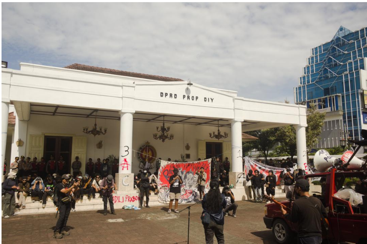
Gambar 1. Demonstrasi penolakan atas revisi UU TNI di depan gedung Dewan Perwakilan Rakyat Daerah Prov. Yogyakarta.

Pada 20 Maret, Dewan Perwakilan Rakyat Republik Indonesia (DPR RI) mengesahkan amendemen Undang-Undang Tentara Nasional Indonesia (UU TNI) tahun 2004, meskipun mendapat protes massa dari mahasiswa dan kelompok masyarakat sipil lainnya. Amendemen tersebut memberikan peran sosial dan politik yang lebih besar bagi militer, di luar peran tradisional mereka di bidang pertahanan. Di bawah UU TNI yang baru, personel militer aktif dapat ditunjuk untuk menduduki 14 jabatan sipil, termasuk beberapa di bidang penegakan hukum. Sayangnya, perubahan pada UU tersebut tidak menindaklanjuti upaya untuk mereformasi sistem peradilan militer, dan hal ini mencegah pengadilan umum untuk mengadili personel militer yang melakukan tindak pidana, sehingga melanggengkan impunitas. Sebuah proposal untuk mengizinkan personel militer memasuki sektor bisnis ditolak karena adanya protes publik yang besar secara nasional.