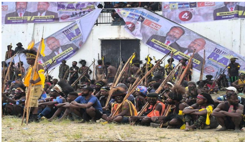
Gambar 2. Kampanye salah satu pasangan calon bupati dan wakil bupati di Kab. Tolikara, Prov. Papua Pegunungan, November 2024.

Pada pertengahan Februari, Mahkamah Konstitusi memutuskan bahwa beberapa pemilihan kepala daerah di West Papua harus diulang, termasuk di Provinsi Papua. Mahkamah membatalkan calon wakil gubernur yang menang karena kecurangan administratif. Pada Maret, Komisi Pemilihan Umum (KPU) Provinsi Papua mengumumkan bahwa pemilihan ulang akan dilaksanakan pada 6 Agustus. 6 Selama kampanye pemilihan Gubernur Provinsi Papua, terdapat ujaran kebencian dan ujaran-ujaran lain yang menghasut yang menyebabkan adanya ketegangan antaretnis dan antaragama di Papua. 7